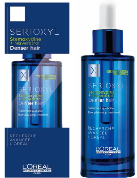
セリオキシルデンサーヘア N 90ST 90mL

抗酸化機能を持つことで知られるポリフェノールであり 肌を守ることはスキンケアなどでよく知られている。